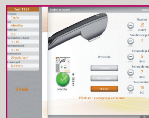
Écran de soin

Le SKIN PERFECT est également compatible avec la pièce à main EVOLUTION permettant de traiter les taches pigmentaires et les imperfections vasculaires.