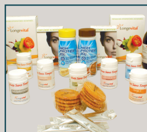
Gamme de compléments alimentaires